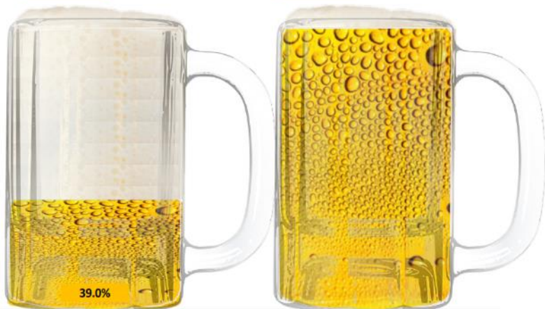
Pago Real cliente

MES: FEB BENEFICIARIO: BI Technologies CERVEZA: Energía realmente útil [kWh] AÑO: 2023 TARIFA: GDMTH ESPUMA: Capacidad o demanda [kW]